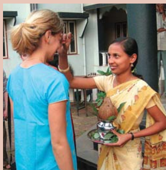
Tradiční indický uvítací ceremoniál.

Od roku 2004 pořádá Charita Praha pravidelně pro zájemce z řad dárců cesty do Indie a Ugandy za rozvojovými projekty. Pro velký zájem nabízíme možnost účastnit se společné cesty do Indie také v roce 2011. Předpokládaný termín je první polovina února 2011.