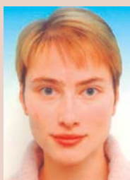
li Mezinárodní den za odstranění

V ážení přátelé, volba termínu pro vydání říjnového Bulletinu Rozvojového střediska není náhodná. Včera jsme si připomněli Mezinárodní den za odstranění